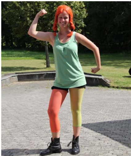
Pipi freut sich auf eine wundercoole Woche

Die Aufregung war gross, als der Pöstler bei Pipi vorbeigekommen ist. Er hat ihr nämlich einen Brief von ihrem Vater mitgebracht, dem König von Taka-Tuka-Land. Judihuiii der Vater holt sie ab und sie fahren gemeinsam auf diese wunderbare Insel, die irgendwo im Meer liegt. Für Pipi ist natürlich sofort klar, dass Annika und Tommy sie begleiten. Wir sind gespannt, was uns alles erwartet!