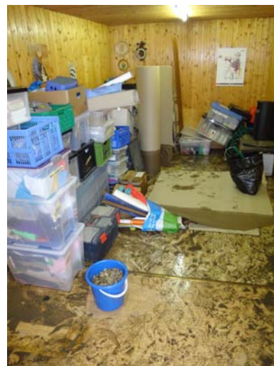
Wasserschäden im Herzlager-Materiallager.

Am 14. Juni hat das Unwetter in Wil (die Stadt mit Stil) unser Materiallager unter Wasser gesetzt. Dank dem Einsatz der Herzlager-Leiter und einigen spontanen freiwilligen Helfern konnten wir das meiste Material retten. Danke! Mal schauen, vielleicht tropft es noch aus der einen oder anderen Kiste.