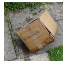
Die Filzwolle hat's nicht geschafft.