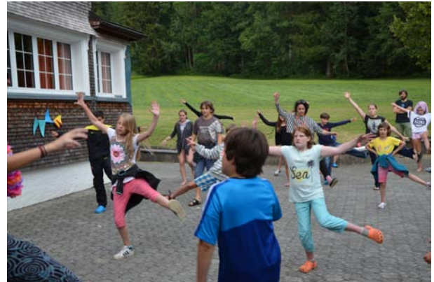
Limbo-Dance auf Taka-Tuka-Land.