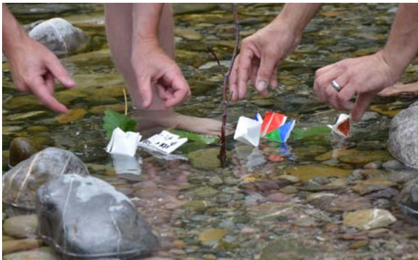
Schon der Start des Schiffli-Wettrennens war wahnsinnig spannend.

Dann kamen wir endlich im Taka-Tuka-Land an. Dort wurden wir freudig von den Ureinwohnern empfangen. Die haben uns an der Strandbar mit exotischen Früchten und Drinks verwöhnt.