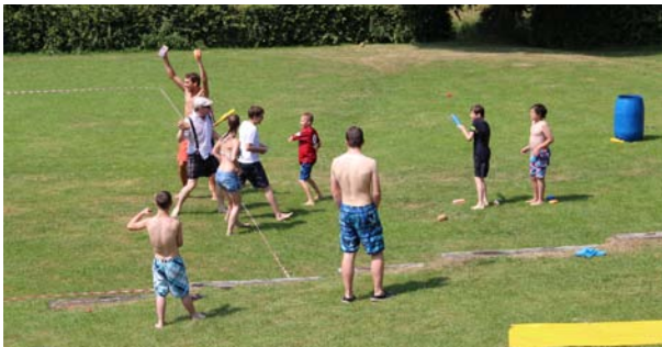
Wasserspass in Taka Tuka Land. Die Leiter gewinnen das nasse Keulen-Völkerball.

Die Freude war aber bald vorbei, denn die Piraten sind aufgetaucht. Mit viel Einsatz und viel Wasser wurden diese mithilfe aller Kinder erfolgreich vertrieben. Juhuuuuu, pflatsch-pflatsch, plätscher-plätscher!