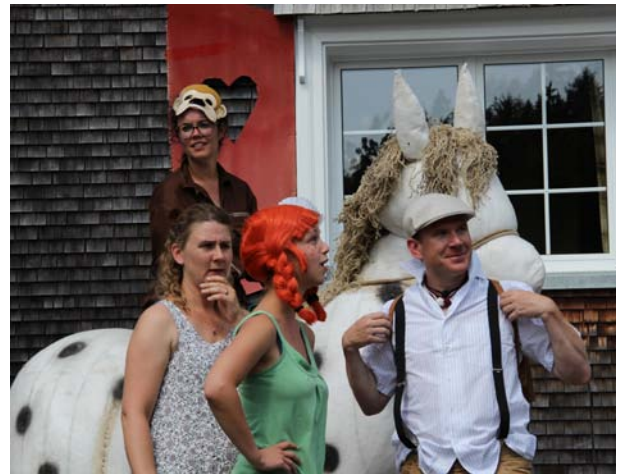
Herr Nilsson, Annika, Pipi, Tommy und der kleine Onkel hecken irgendwas aus.

Die Glaskugel sagt uns, dass wir eine wunderbare Woche mit viel Spass und Spannung erleben werden. Annika und Tommy werden viel Neues entdecken und sich manchmal auch ein bisschen necken.