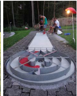
Der Sieger im Minigolf ready für den Ausgang am Abschlag: Cedric!