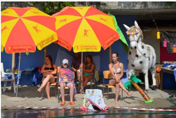
Schickeria auf dem Taka Tuka Strand.