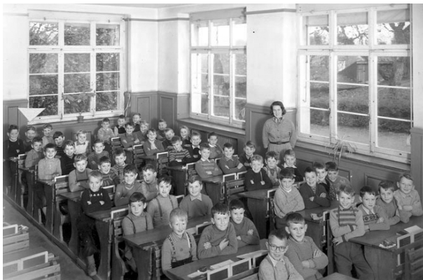
Alle freuen sich, nach den langweiligen Ferien wieder zur Schule gehen zu dürfen.

Wie jedes Jahr gegen Ende der Sommerferien wird es einem langsam langweilig und man möchte wieder zurück in die Schule. Der Lehrer jammert: "Diese Sommerferien sind doch viel zu lang. Sie unterbrechen nur unnötig die Schule." Und so freuen sich alle Kinder auf die Schule, auf das Lernen und besonders auf die Prüfungen.