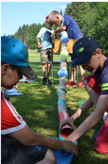
Chügelibahn ohne Looping.