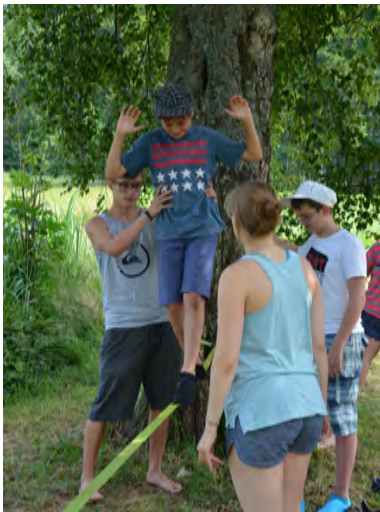
Elias besteht den Schwindelfrei-Test. Super.

Heute ist Käptän Efraim Langstrumpf in der Villa Kunterbunt angekommen. Er hat Annika und Tommy und allen Kindern nicht geglaubt, dass sie geeignet sind für die Hopetosse und für die grosse Überfahrt auf die Taka-Tuka-Insel. Doch die Kinder haben in verschiedenen Tests bewiesen, dass sie nicht seekrank werden, schwindelfrei sind, gruusig tun können, und Knoten knöpfen können.