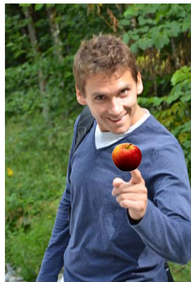
An apple a day, keeps the doctor away.