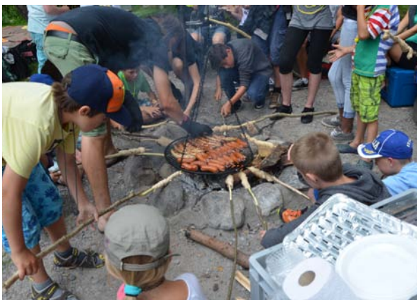
Die wohlverdiente Stärkung nach dem anstrengenden Schiffli-Wettrennen.