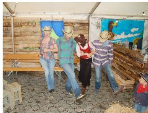
Wildes Treiben im Saloon von Lucky Town