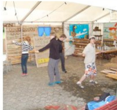
Der ruhige Tag in Lucky Town verleitete zu einem intensiven Tanz-Training.

Um 15:00 Uhr ging der Alarm. Dann durften wir wieder aus dem Zimmer. Nachmittags hatten wir verschiedene Sachen machen können. Zum Beispiel Massieren, Lose kaufen, Tatoo machen oder Tanzen. Nach diesen Sachen gab es bald Nachtessen, es gab Resten und verschiedene Salate.