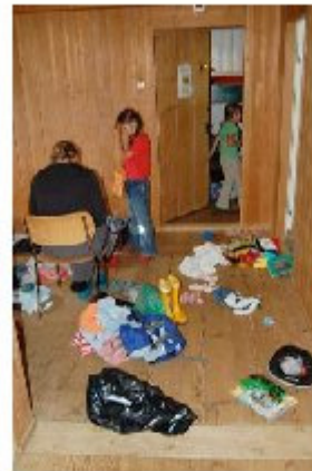
Die jungen Cowboy und -gils packen um nach Kalifornien aufzubrechen.

Am Abend ging dann dieses grosse Cowboy-Fest statt. Es gab Hamburger, Guggeli und Fingerfood. Dannach gab's draussen einen Drink und der Tanz wurde vorgeführt. Dann ging der bunte Cowboy-Abend richtig los mit ganz vielen Darbietungen. Es gab Zaubertricke, Akrobatik, ein Quiz, ein Theater und vieles mehr. Zum Dessert gab's dann noch eine feine Glacé.