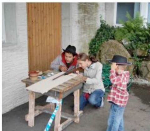
Das Hilfssheriff-Training beinhaltet auch ein intensives Schiessstraining.