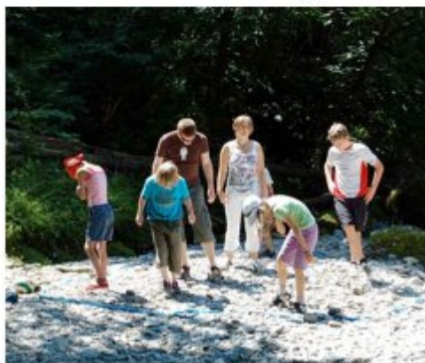
Eifrige Goldsuche am Golden Ret River.