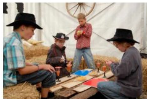
Nach der Hilfssheriff-Vereidigung wurde der Saloon speziell geöffnet für eine ausgiebige Feier.

Nach dem Mittagessen mussten wir unser Können in schwierigen Prüfungen (Lasso werfen, Büchschenschiessen, etc.) unter Beweis stellen. Nach einem reichhaltigen Abendmahl erklärte uns der Sheriff alle zu Hilfssheriffs. Danach fielen wir müde in die Betten