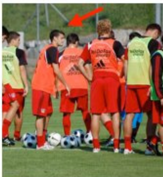
Tranquillo Barnetta mit seinen Team-Kollegen.

Nach einer ganz kurzen Siesta sind wir mit den Bussen nach St. Gallen gefahren, wo wir uns das neue Fussballstadion anschauen konnten. Anschliessend besuchten wir das Training des FC St. Gallen. Gleich daneben entdeckten wir Tranquillo Barnetta, der ebenfalls trainierte, und wir hofften auf eine Unterschrift. Leider reichte es zeitlich nicht mehr.