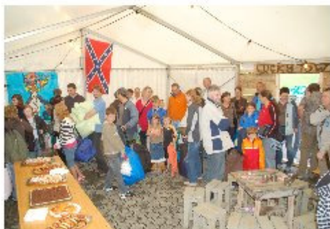
Die neuen Bewohner von Lucky Town müssen sogar anstehen für den Einlass ins Städtchen.

Nach dem Sonnenuntergang im Regen gingen die Bewohner langsam ins Bett und der erste Tag in Lucky Town neigte sich dem Ende entgegen.