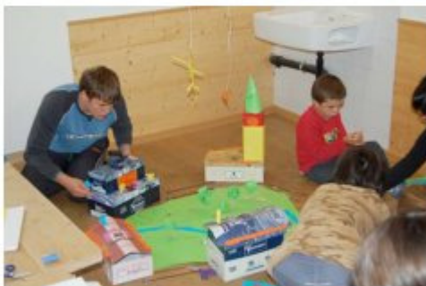
Fleissige Städtebauer am Werk.