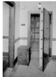
Die Lucky Town Bank erneuert ihre Sicherheitstüren.

Solche oder ähnliche Geschichten erleben die Bewohner von Lucky Town in letzter Zeit immer häufiger. Diese Woche lies die Bank ihre