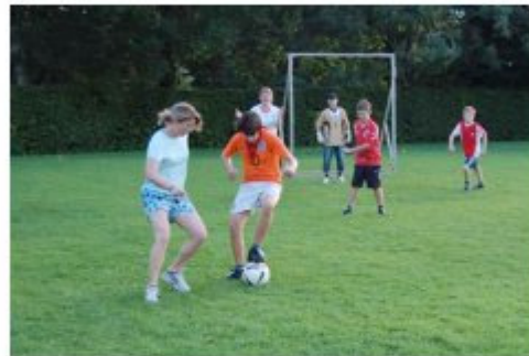
Der Fussball-Fight zwischen den Kickfoot-Indianern und den Lucky Town Bewohnern.

Wieder zurück stärkten wir uns beim Nachtessen um anschliessend voller Kampfgeist in das Duell mit den Kickfoot-Indianern zu treten. Wir wollten unbedingt diese Schatzkarte kriegen um die Tasche mit all unseren Portemonnaies zu finden. Leider verloren wir dieses Fussballspiel. 1:0 für die Indianer! So geht ein weiterer ereignisreicher Tag in Lucky Town zu Ende.