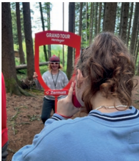
Willkommen in Zermatt.