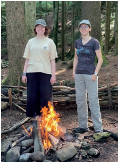
Das Feuerli für das Mittagessen brennt schon.

Mit der letzten Seilbahn sind wir noch rechtzeitig zur Abfahrt unseres Nachtzuges zurückgekommen.