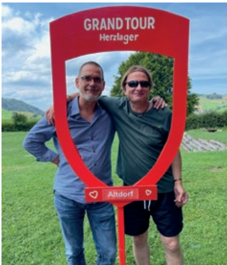
Musikalischer Genuss in Altdorf.

Nach der durchzechten Nacht brauchten wir alle etwas mehr Schönheitsschlaf und gingen darum später Morgenessen. Um uns auf den Nachmittag vorzubereiten haben wir uns einen Beauty-Morgen gegönnt. Die Haare frisch gestylt, mit maskenreiner Haut, neuen Tattoos und bunten Fingernägeln sind wir bereit für das anstehende Konzert in Altdorf, zu welchem auch zukünftige Lagerkinder eingeladen waren. In der Pause entführten die Assistenz-Assistenten die Musiker zum Ping-Pong.