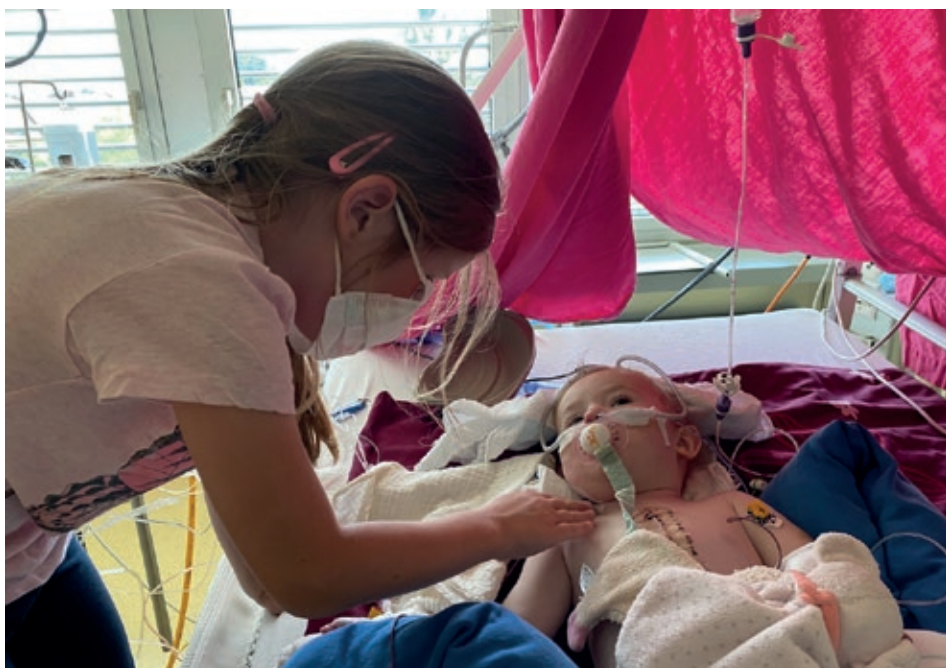
Stolze grosse Schwester – auch am Krankenbett.

Wir spielen gerne Rollenspiele mit den Bábies oder Barbies oder verkleiden uns. Manchmal bin ich auch ihre Ballettlehrerin und wir tanzen zusammen. Manchmal spielen wir auch Spital mit unseren Bábies oder Plüschtieren. Wir haben