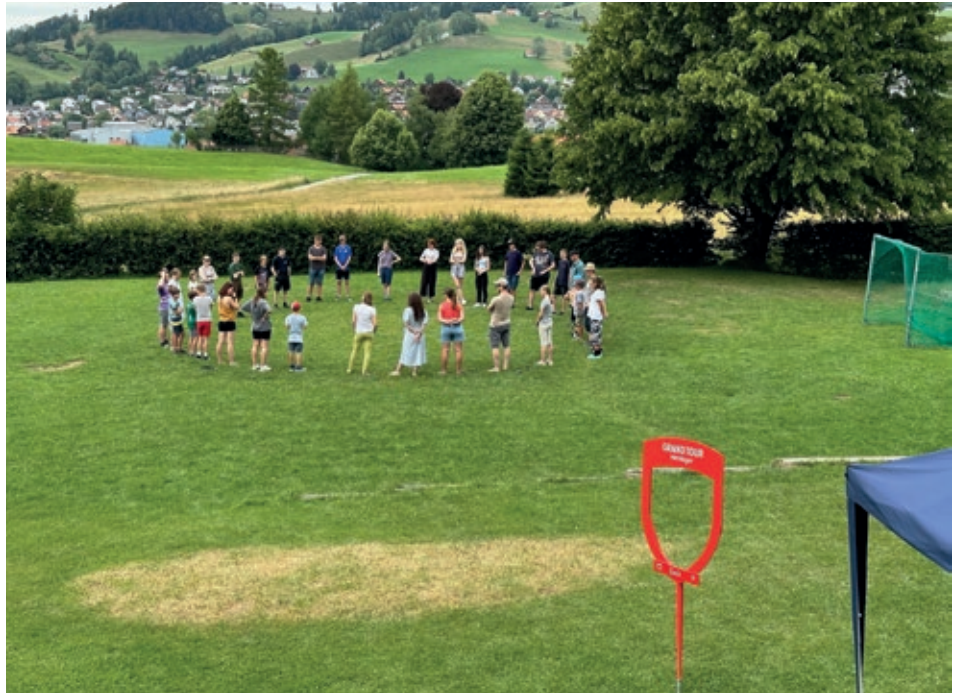
Die Assistenz-Assistenten sind eingetroffen.

ersehnte Eintreffen der Kinder vorbereiten. Dann endlich Samstag, alle sind da und bereit, in die Woche zu starten. Die Kinder sind angekommen und haben sich von den Eltern verabschiedet. Manche konnten es kaum erwarten, wieder hier zu sein und andere hatten etwas Trennungsschmerz. Die langjährigen Lager-Kinder zeigten den Neuen, wo die Zimmer sind und alle haben ihre Sachen eingeräumt.