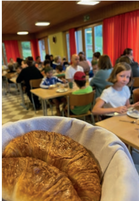
Bonjour aus der Westschweiz.

Unser letzter Reisetag führt uns in die Westschweiz zu Croissants, Apéro, savoir vivre. Wir feiern den Abschluss unserer Schweizerreise mit einer grande fête. Diese wird eifrig vorbereitet, eingerichtet, dekoriert und les cocktails werden vorbereitet. Das schöne Geschirr wird poliert, die Band übt und Showeinlagen werden einstudiert. Der herzlichen Ver-