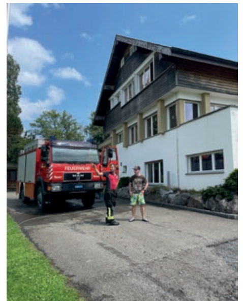
Verdiente Abkühlung für die Assistenz-Assistenten.