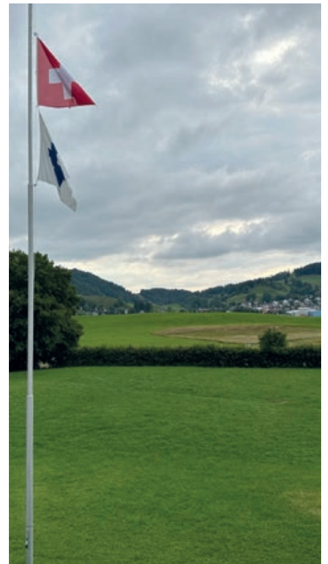
Danke für die tolle Reise und bis bald.