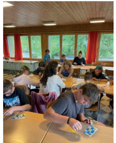
Die Reisekasse muss gefüllt werden.

Früh am Morgen der grosse Schreck, all unser Geld ist weg. Wie soll unsere Reise weitergehen? Die Assistenz-Assistenten sind eingesprungen und haben erfolgreich im Casino die Reisekasse gefüllt. Unsere Weiterreise ist gesichert. Herzlagerliches Dankeschön! Die Feuerwehr kommt am Nachmittag vorbei, um uns beim Abkühlen nach dem anstrengenden Casino zu helfen. Mit viel Tatü-Tatataa sind die Assistenz-Assistenten aus der Siesta zur Wasserschlacht gerufen worden.