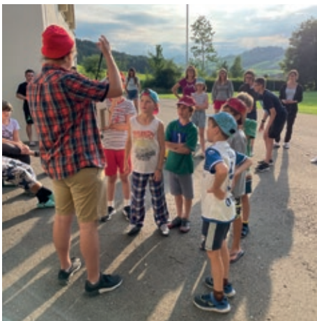
Die Assistenz-Assistenten erhalten ihren Ausweis.

Gestern Abend durften wir das Lagerhaus übernehmen und uns auf das lang-