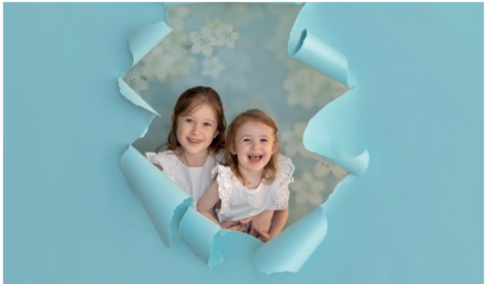
Mein Lieblingsbild mit meiner kleinen Schwester.

Wie ist es eigentlich, wenn man Bruder oder Schwester eines Herzlis ist? Welche Ängste hat man? Ist die spezielle Geschwister-Verbindung noch stärker? Oder gibt es auch mal, wie üblich unter Geschwistern, Streit?